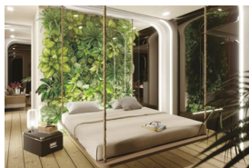
Green Boat | S. Menduni