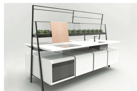
Cucina serra | A. Mazzotta